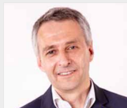
NORBERT SEIDL 1. Bürgermeister Puchheim Regionale Entwicklung, interkommunale Zusammenarbeit, Asyl