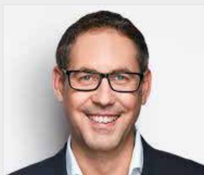
MICHAEL SCHRODI Bundstagsabgeordneter Schule/ Bildung, Bund/ Land